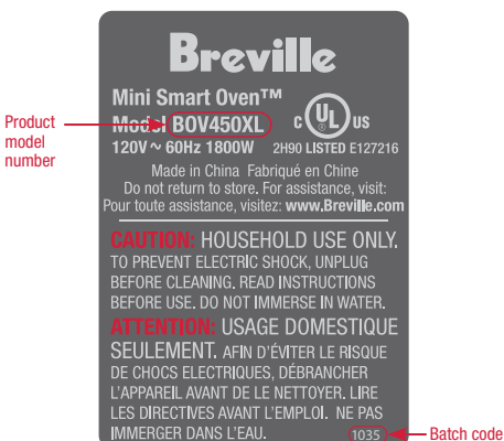
Example only. The placement of the "product model number" & "batch code" may differ slightly on your product.